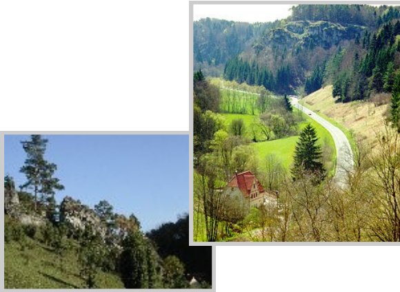
Kleinziegenfelder Tal und Schrepfersmühle

bietet Ihnen eine Vielzahl an gut markierten Wanderwegen und Naturschönheiten (u.a. der Kordigast, Kleinziegenfelder Tal, Bärental und vieles